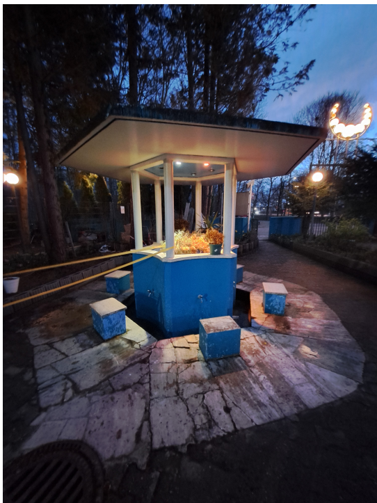
Schadirwan im Hof der Freimanner Moschee